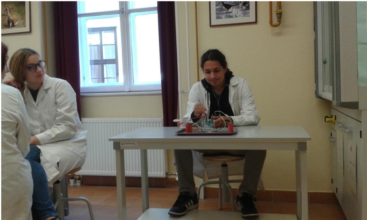
Felelés az előző óra anyagából (modul)