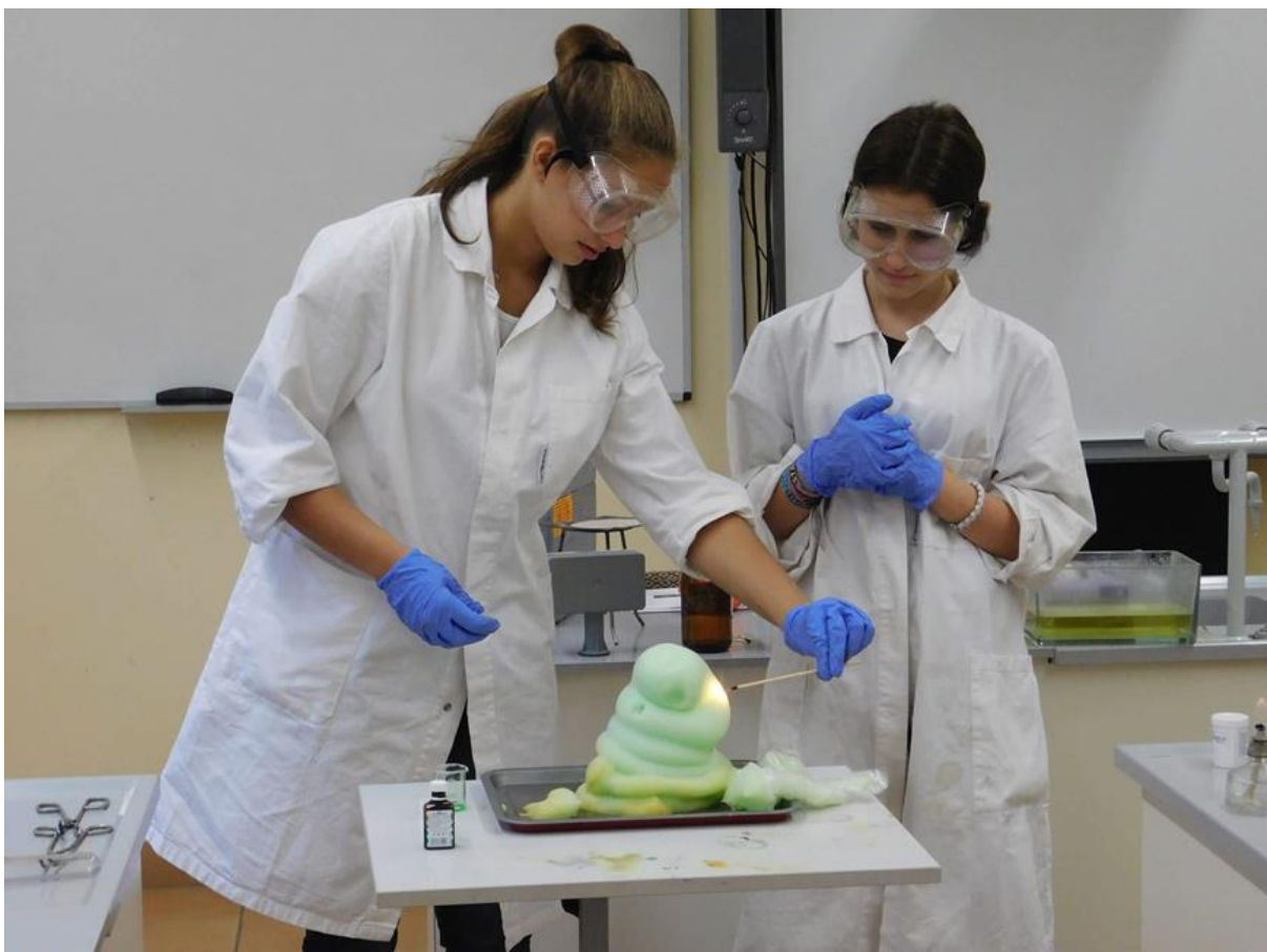
A látványos kísérletek a kedvencek (modul)