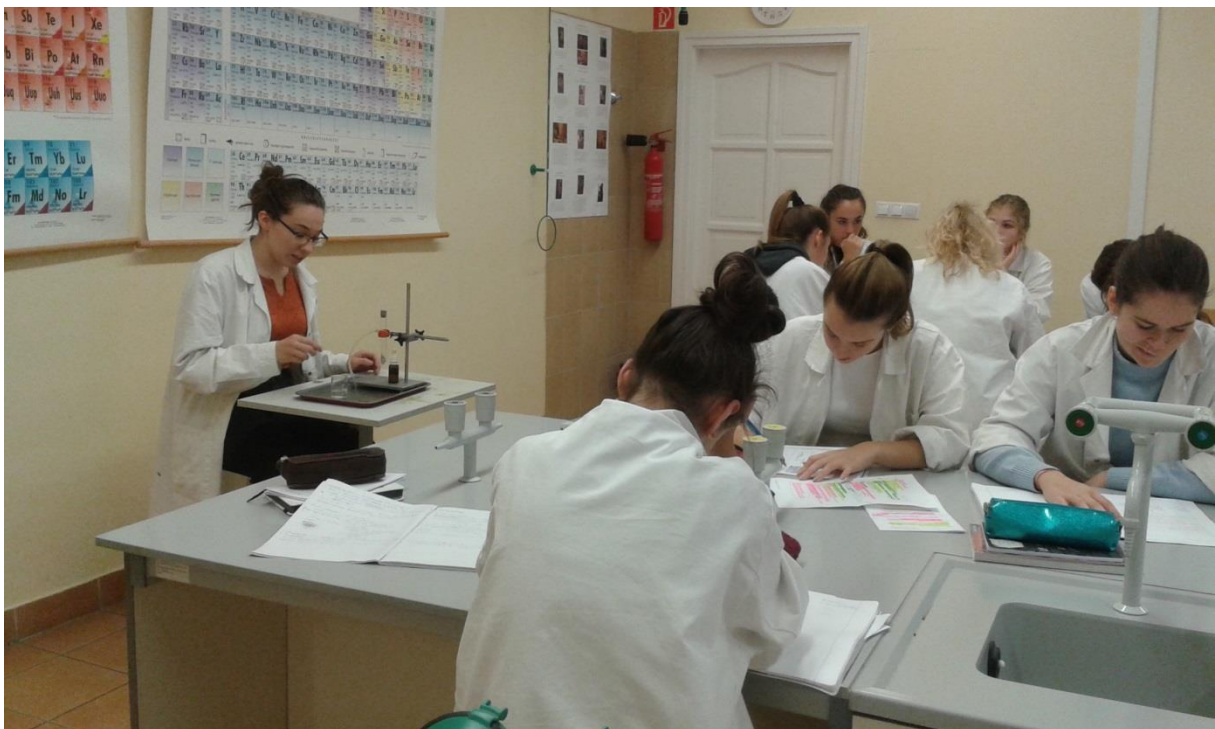
Felelés az előző óra anyagából (modul)