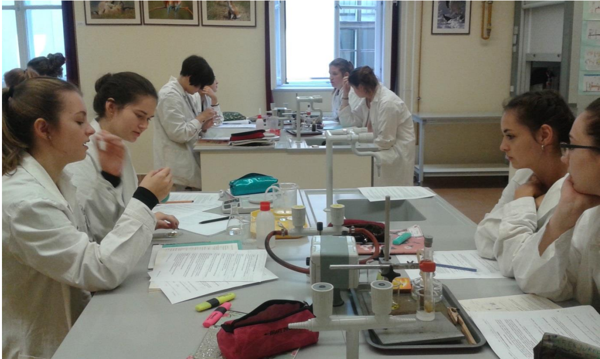
Órai munka modulórán